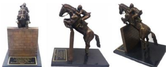
Troféu Perpétuo NELSON PESSOA, escultura em bronze obra do artista Marco André de Salles, celebrando o Record Mundial de Salto sobre Muro à 2,33m, em Longchamps, 1983, com a égua MISS MÖET

Juniors, Young Riders, Seniors Competição em 2 Voltas - Tab.A 273.2.2/273.3.3.1 e 273.4.3; passagem Decisiva Velocidade, 375m/min Altura dos obstáculos: 1,40m a 1,45m Nº cavalos/ cavaleiro: 1 Premiação Total em espécie: R$ 80.000,00 (distribuição conforme Tabela)